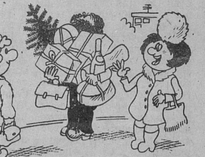
— Знакомься — это мой муж!