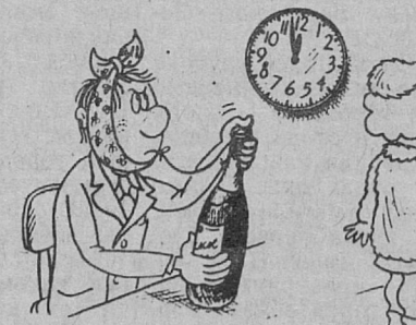
Когда болит зуб...