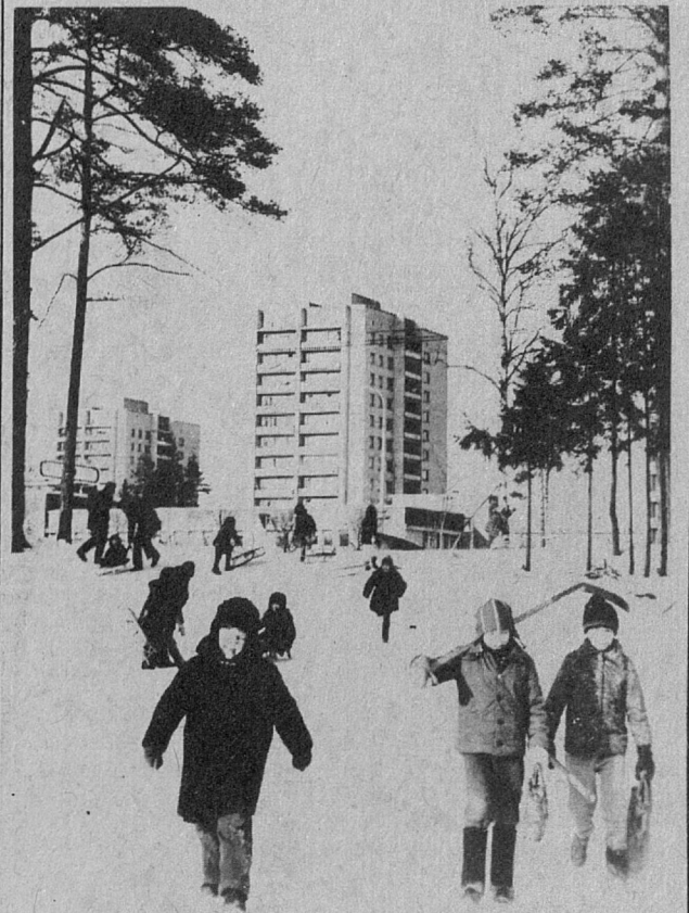
И щеки румянит зима...