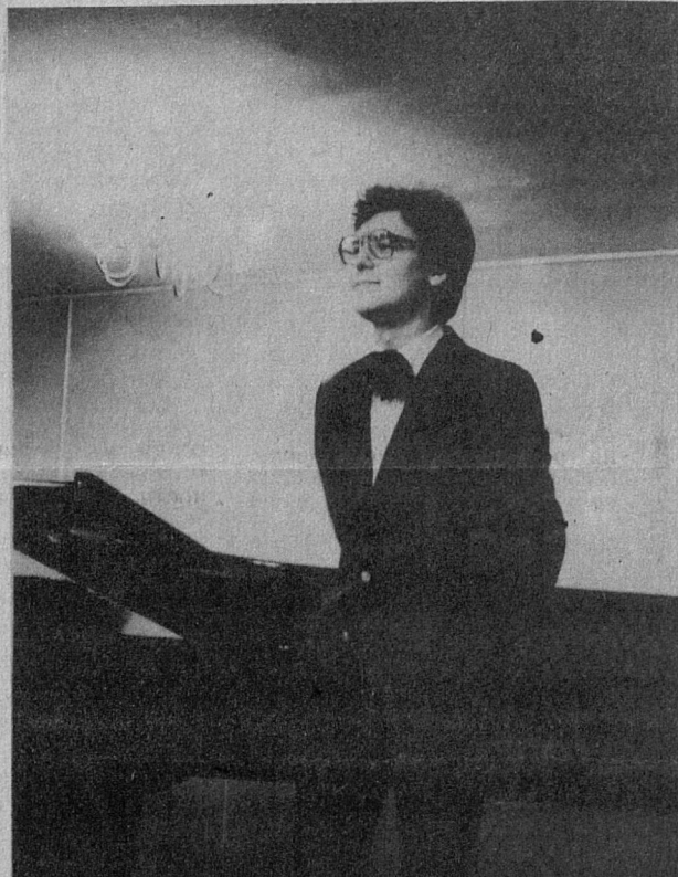
НЕДАВНО в Сосновом Бору побывал лауреат республиканских и всесоюзных конкурсов, лауреат II международного конкурса пианистов и скрипачей в Японии Александр Целиков. В музыкальной школе состоялся авторский концерт молодого пианиста.

К 40-летию ПОЛНОГО ОСВОБОЖДЕНИЯ ЛЕНИНГРАДА ОТ БЛОКАДЫ