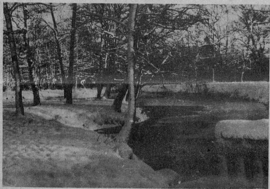
В зимнем парке — тишина.