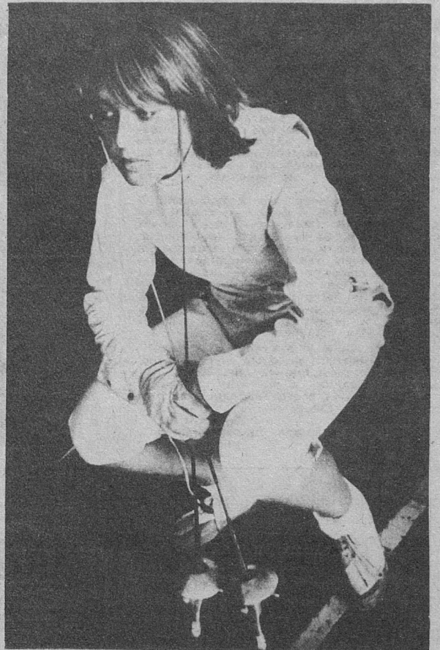
В. Табачков «Фехтовальщица».