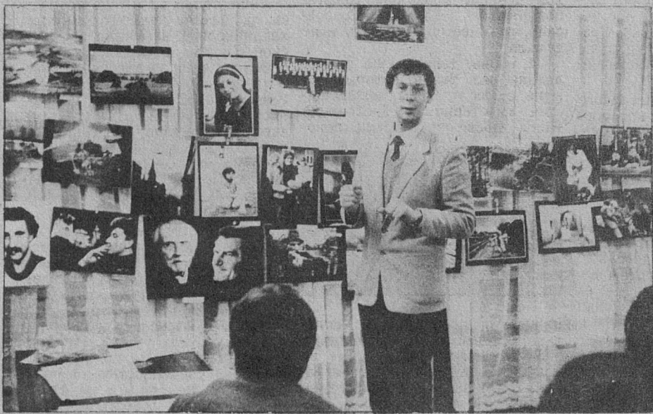
Редактор Н. З. СБИТНЕВ

Члены фотоклуба приглашают всех желающих принять участие в обсуждении новых работ, участвующих в кольцевом обмене в третий и четвертый четверг каждого месяца в ДК «Строитель» в 19 часов. С. ГЕОРГИЕВ На снимках (внизу) — обсуждение коллекции Львовского фотоклуба.