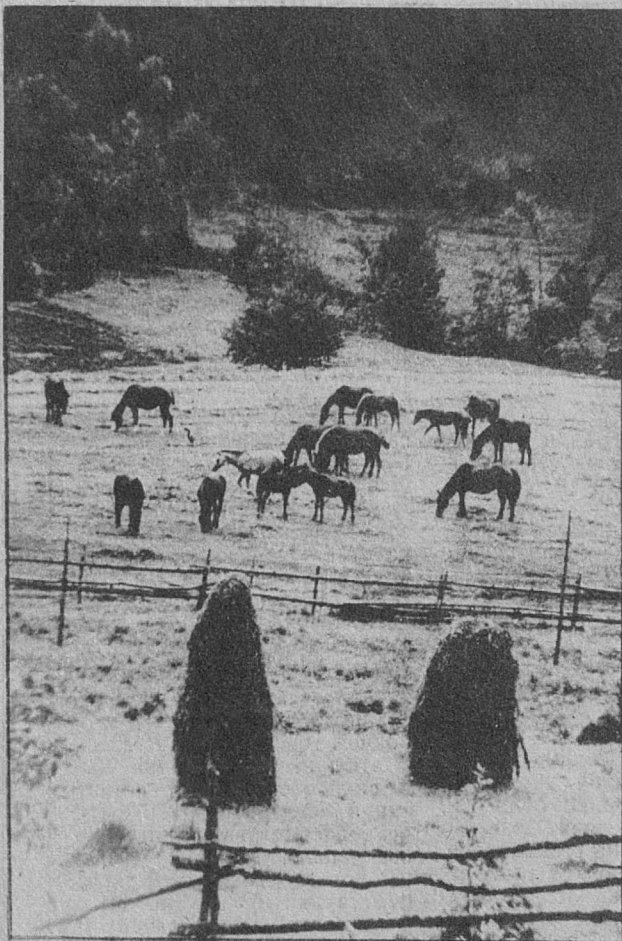
В. Дубас. «Август в Карпатах».