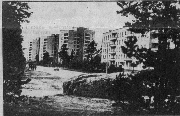
Улица Солнечная.