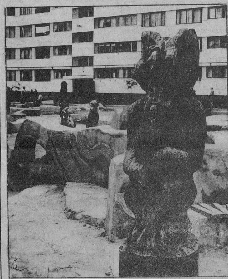
В нашем дворе.