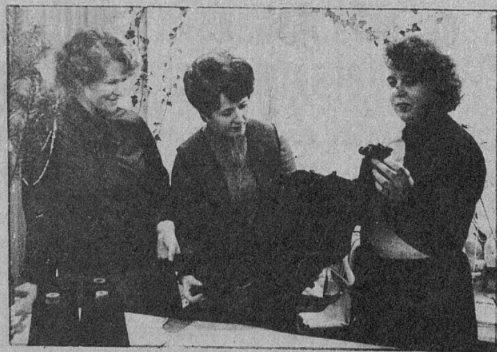
КОЛЛЕКТИВ трикотажного ателье первым среди подразделений горбывуправления выполнил годовой план и задания четырех лет пятилетки. Среди вязальщиц трикотажных изделий развернулось соревнование по выполнению пятилетнего плана к 40-летию Победы.