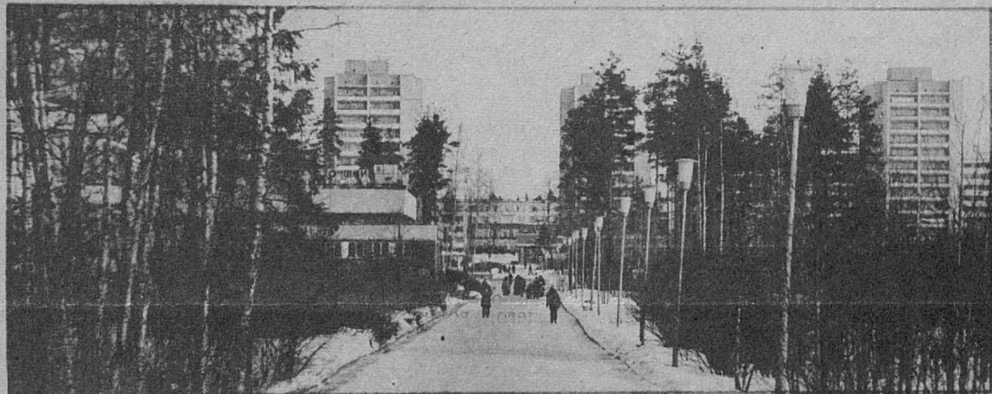
Улица Солнечная в зимний день.