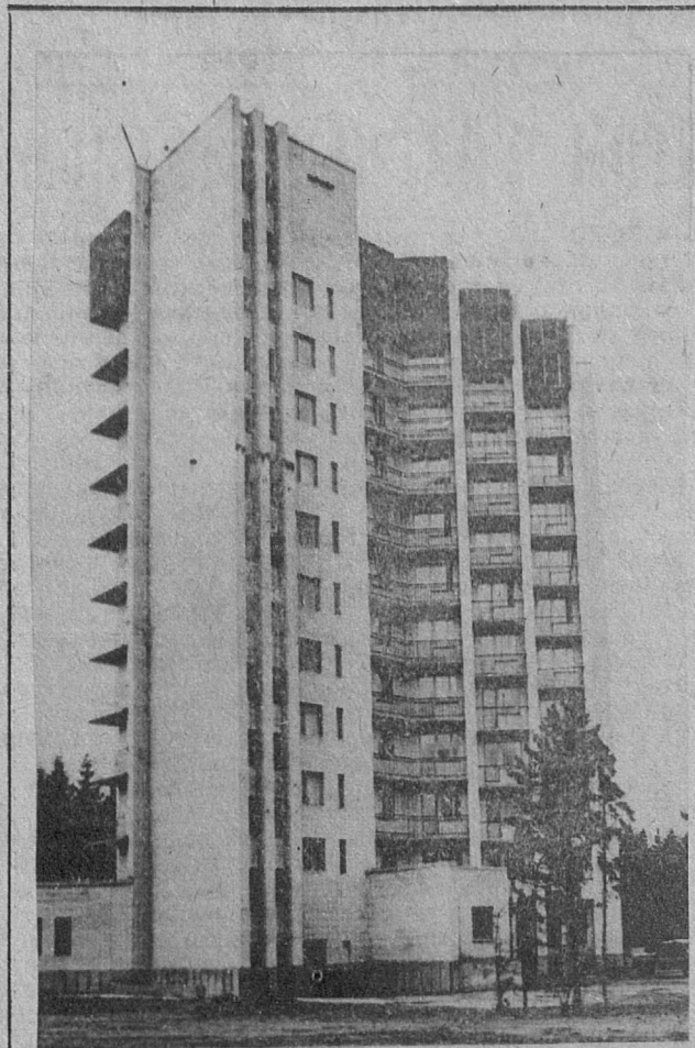
Завершено строительство гостиницы «Академическая».

СОСТОЯЛОСЬ расширенное заседание партийного комитета Ленинградского института ядерной физики, на которое были приглашены секретари цеховых партийных организаций. На заседании обсуждался такой важнейший вопрос, как «О плане организационной и массово-политической работы парткома по подготовке и проведению выборов в Верховный Совет СССР». Были обсуждены задачи, стоящие перед коммунистами в период выборной кампании, утвержден план конкретных мероприятий, график дежурств членов парткома в агитпункте. На заседании парткома были утверждены руководитель агитколлектива, редактор стенной газеты, заведующий агитпунктом. Все эти ответственные участки возглавили коммунисты.