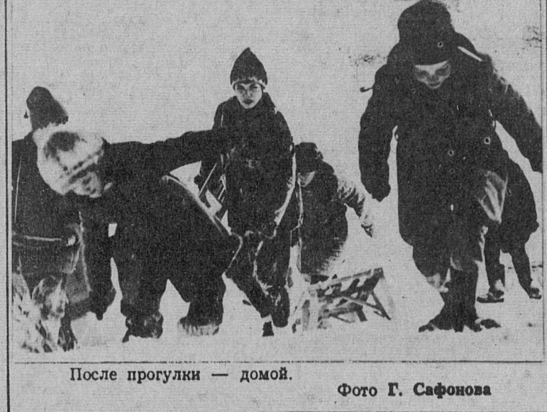
После прогулки — домой.