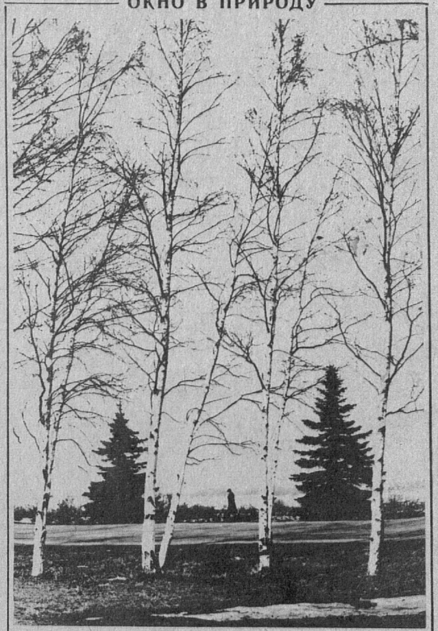
Весеннее кружево берез.