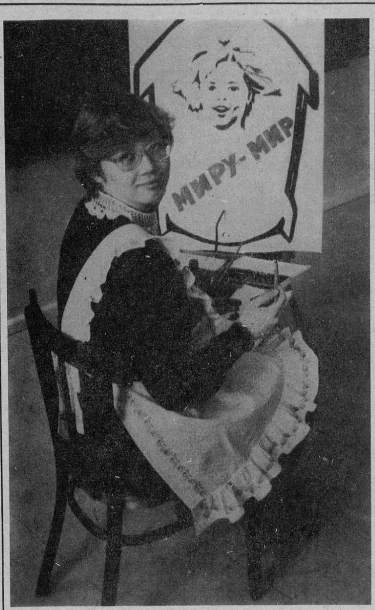
Мы — за мир.