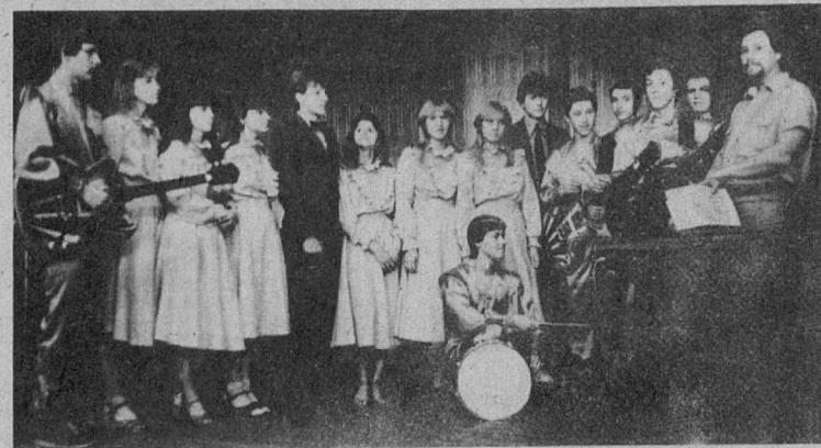
Материалы страницы подготовлены А. СТАСЕЛЬНО.