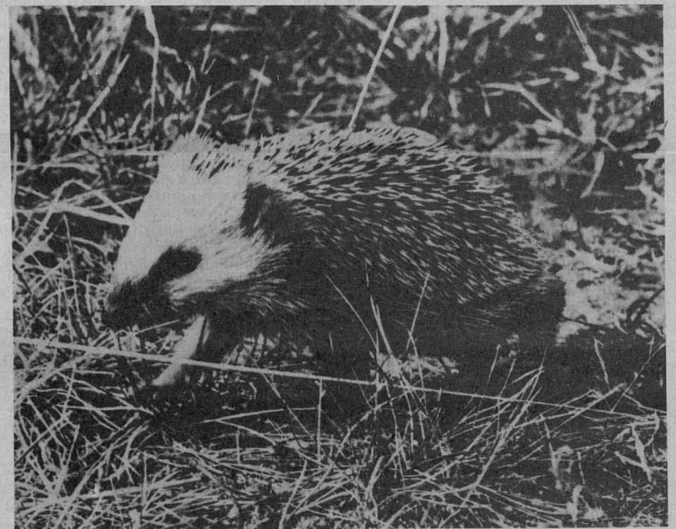
Вышел ежик погулять...