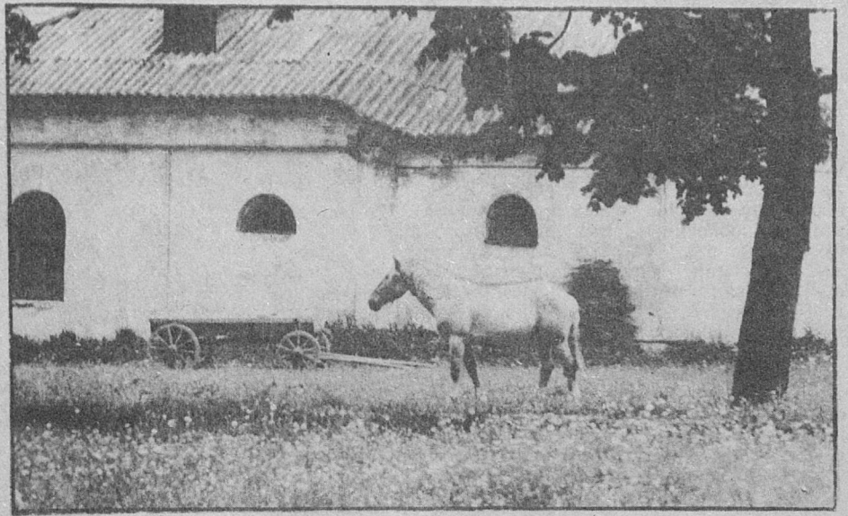
В деревне летом...