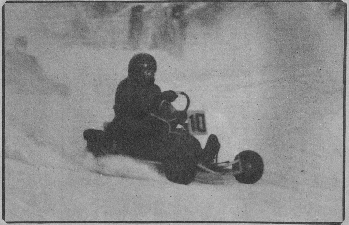
НА стадионе спортивно-технического комплекса ЛАЭС состоялись соревнования по картингу (треновая гонка) на «Кубок ЛАЭС имени В. И. Ленина». На старт соревнований вышло 27 сильнейших спортсменов, представляющих 12 команд: Ленинграда, Эстонии, Соснового Бора.

Приглашаются все желающие. Проезд электропоездом. 26 ЯНВАРЯ в шахматном клубе ДЮСШ горно (проспект Героев, 62) проводится розыгрыш кубка по шахматам. Приглашаются все желающие. Начало в 10 часов.