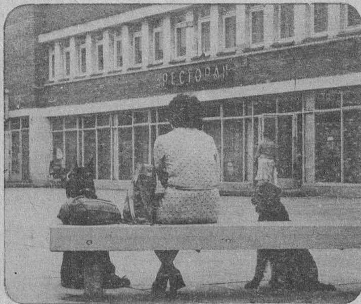
Этой фотографией, сделанной нашим общественным фотокорреспондентом Ю. Рыжовым, мы решили продолжить мини-конкурс «Что бы это значило?»

Напоминаем, что число ответов и участников конкурса не ограничено. Итоги, в которых непременно найдут достойное отражение фамилии и мнения лучших юмористов города, будут подведены через две недели. Ждем ваших писем!