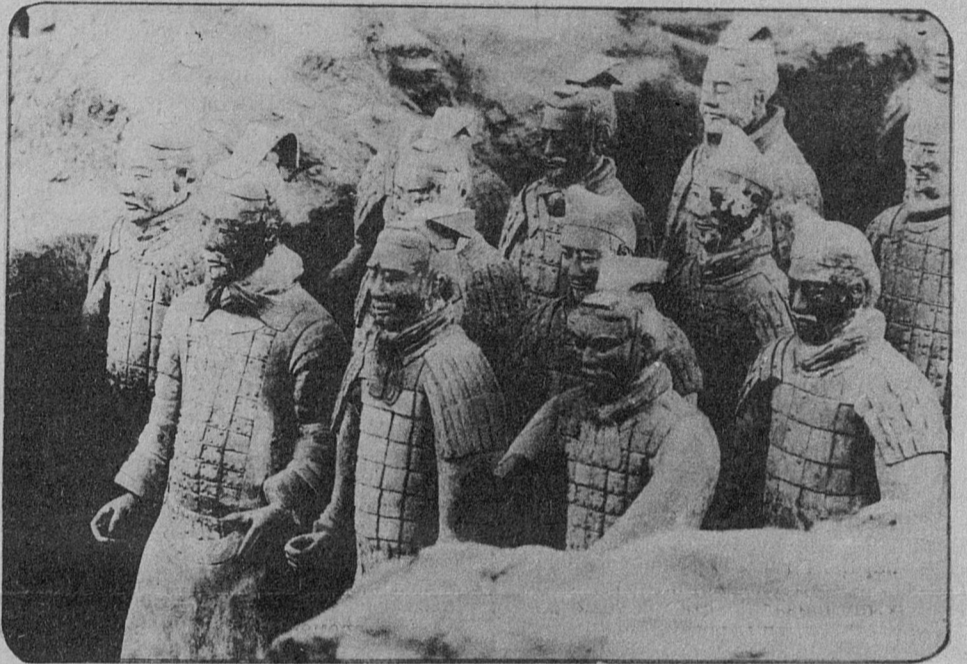
Почти 12 лет продолжают археологические раскопки в китайской провинции Шэньси. Начало исследованиям положила находка в 1974 году во время ирригационных работ древнего захоронения. Прибывшие на место захоронения археологи установили, что случай помог обнаружить гробницу Цинь Шихуана — первого императора династии Цинь, правившей в Китае 21 век назад. Гробницу грозного правителя окружают восемь тысяч глиняных статуй воинов в полном вооружении в пешем строю и на конях. Неизвестные скульпторы древности придали каждому из них не повторяющиеся ни разу выражение лица. Ряды воинов окружают гробницу и

всем своим видом выражают решимость защитить своего императора от посягательств злых сил загробного мира.