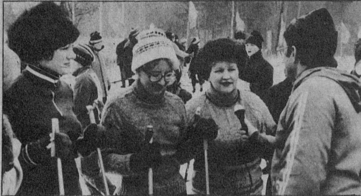
наступающие дни отдыха вас по-прежнему ждет лыжня-86. А. ИВАНОВ На снимках: стартуют участники праздника; интервью для ленинградского телевидения.

...Всесоюзная неделя лыжного спорта прошла. Подведены ее итоги. Но продолжается зима. И в