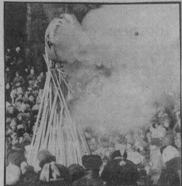
праздникам возрос. И под- работников культуры. Л. ЗЕРНОВА

Нынешние проводы зимы были самыми многолюдными из всех предыдущих. Это говорит о том, что интерес горожан к безалкогольным массовым