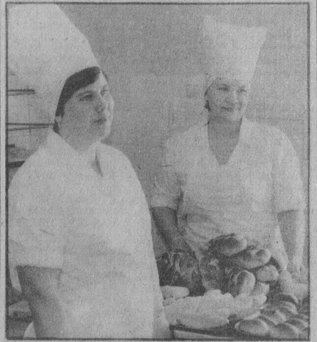
Чтобы пирог получился вкусным...

Надеемся, публикации ваших корреспонденций помогут решить ряд наболевших вопросов. Ждем ваших писем.