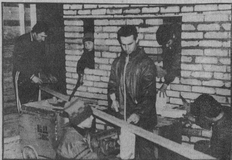
Лыжероллерная трасса в деревне Липове позволяет биатлонистам заниматься любимым видом спорта и зимой, и летом. Но весна и у них — пора межсезонья.

— Есть желание у педагогов, есть желающие среди родителей. Но для обучения шестилеток мало классов, нужны еще игровые и спальные помещения. А обеспеченность необходимыми площадками в школах, как отмечалось на недавнем собрании актива городской партийной организации, составляет в Сосновом Бору чуть более 70 процентов. Вот почему с