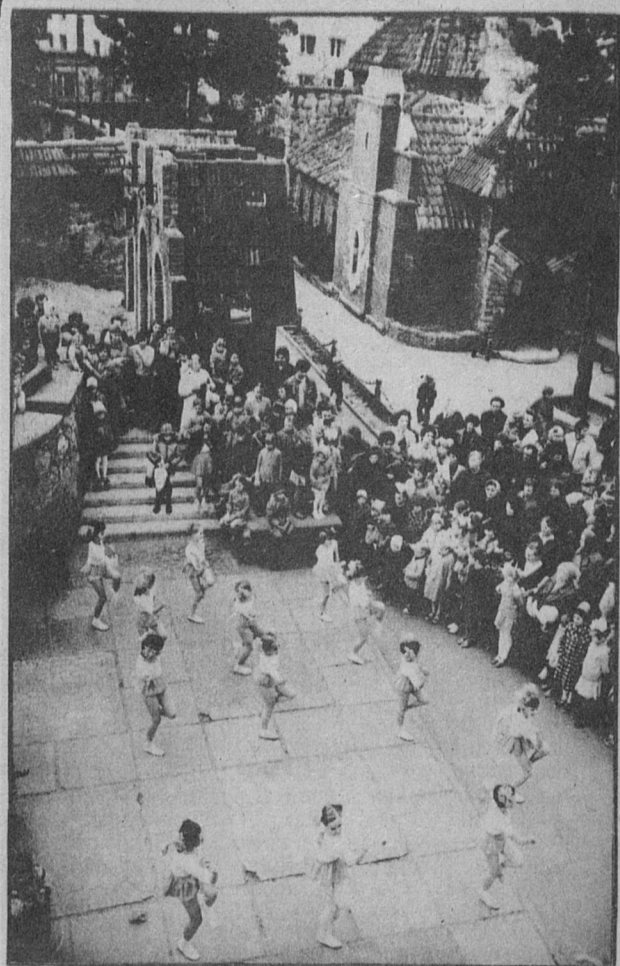
На Ратушной площади Андерсенграда показывают свое искусство девочки из хореографического ансамбля Дома пионеров и школьников. Сегодня выходной, и праздник в Андерсенграде привлек к себе внимание множества зрителей. Здесь, мамы и мамы, бабушки и дедушки и, конечно же, ребята.

За шесть лет своего существования Детский игровой комплекс стал для многих сосновоборцев любимым местом семейного отдыха. Сотрудники Андерсенграда планируют проведение многих мероприятий именно на субботу и воскресенье.