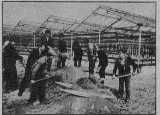
На снимке: бойцы трудового отряда старшекласников школы № 5 работают в совхозе «Сосновоборский».