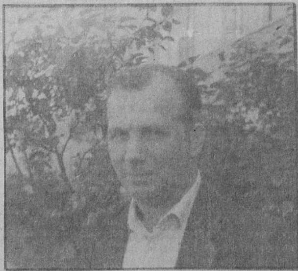
ЧЕСТЬ ПО ТРУДУ

Ремонтники — народ скупой на эмоции. Во всяком случае, на производстве. Наверное, ответст-