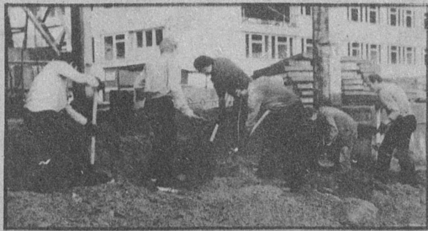
АДРЕС МЖК — СОСНОВЫЙ БОР

До мелочей была продумана организация субботника, заранее подготовлен фронт работ. Не было беготни в поисках инструмента, каждому нашлись рукавицы, даже респираторы выдали. Удивительно? Нет, закономерно. Ошибаются те, кто