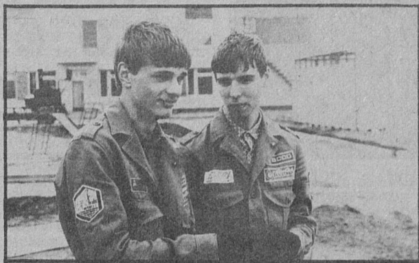
НА СТРОЙКЕ — ССО