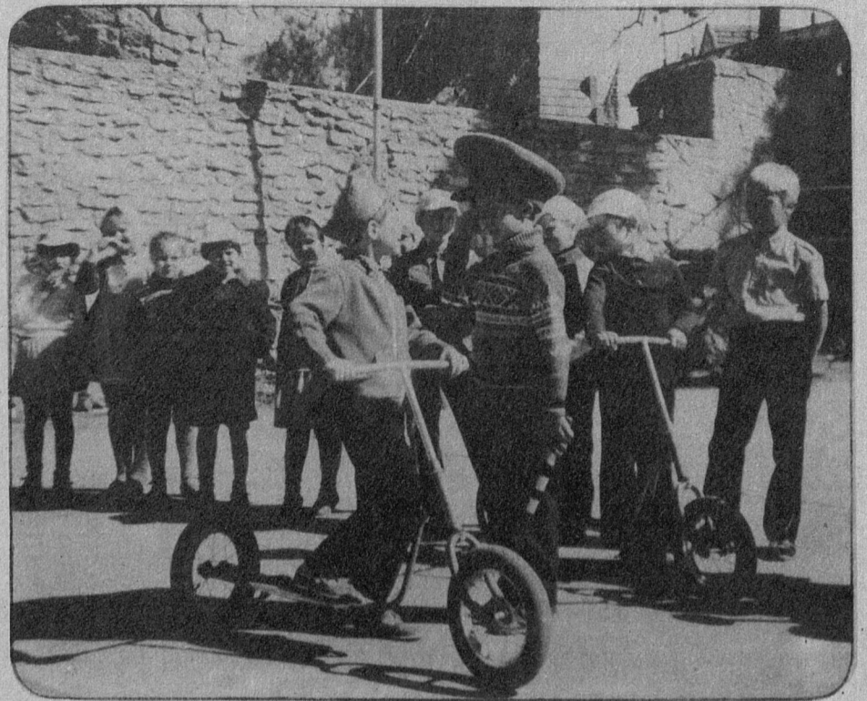
«Ваши права, товарищ водитель!»