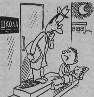
Папа мне сказал: без учителя домой не возвращайся! Улыбался художник В. МИЛЕЯКО