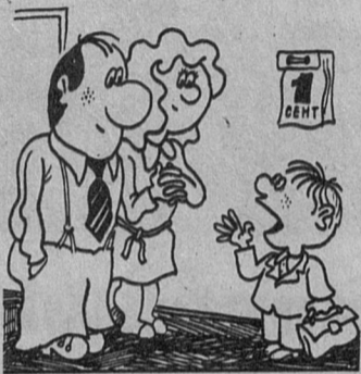
В школе понравилось, но почему-то сказали, что завтра нужно придти опять!