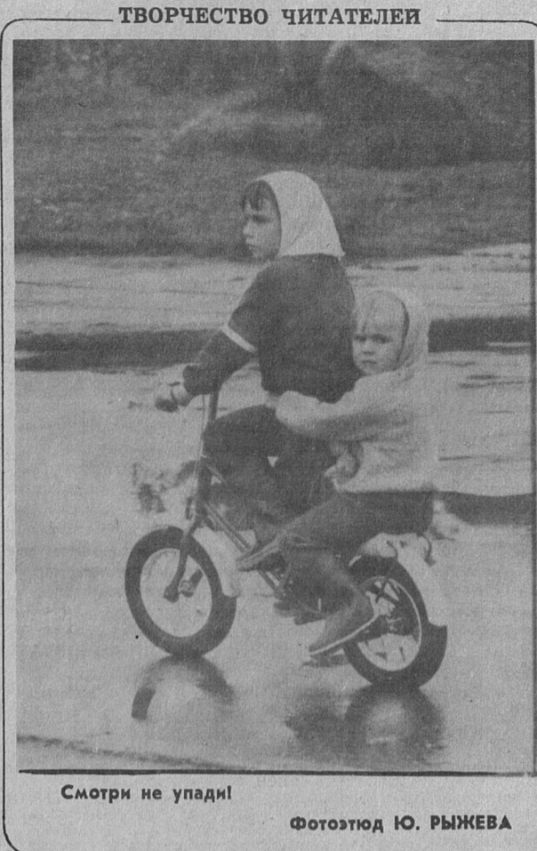
Смотри не упали!