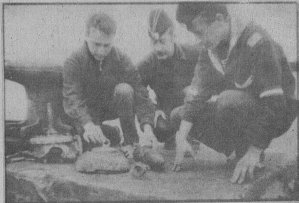
НА СНИМКАХ: именной буй; драгоценные реликвии — на палубе «Сахалинца».