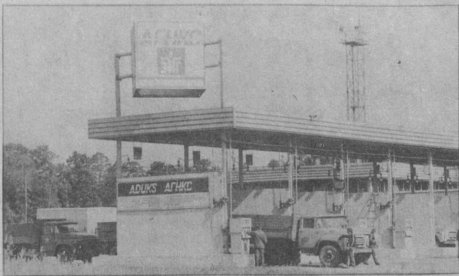
На соискание Государственной премии СССР. Новая автомобильная газонаполнительная станция в Вильнюсе. Использование транспортных средств на газу в качестве топлива для автомобилей уменьшит отрицательное воздействие