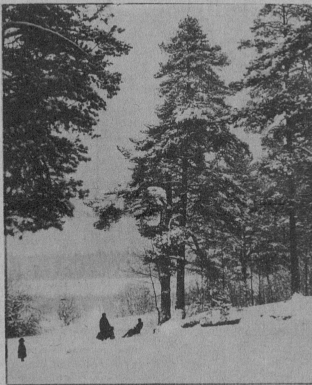
НА ТЕМЫ ДНЯ