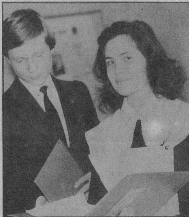
ТВОЯ СТРОКА В УСТАВ ВЛКСМ