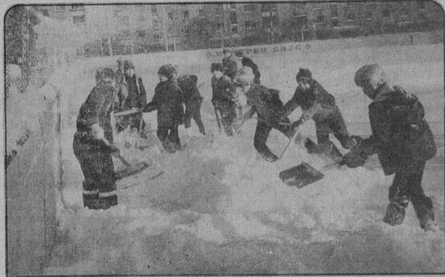
Занесла снегом метель дороги и улицы города, дворы и спортивные площадки. На дорогах работает снегоочистительная техника, дворы и тротуары расчищают дворники. А свою спортплощадку во дворе дома 14 по Солнечной