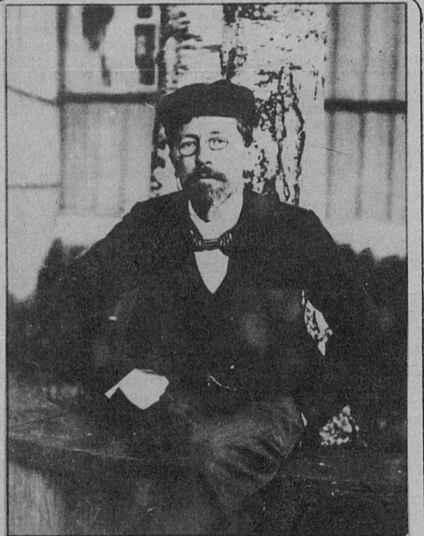
Уральский автограф А. П. Чехова

О пребывании Чехова на Урале написано немало. Впервые он побывал здесь в 1890 году проездом на Сахалин. А через двенадцать лет, в 1902 году, он приезжает на отдых по приглашению фабриканта Саввы Морозова в его имение во Всеволодо-Вильеве неподалеку от Усоляя. К этому второму приезду Чехова в Прикамье и относится этот снимок.