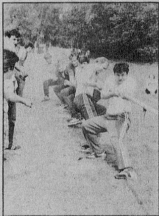
На берегу реки Воронки, на том месте, где когда-то была деревня Лужки, сожженная фашистами, состоялся туристский слет, в котором приняли участие десять команд из Ленинграда и области. Первое место по итогам проведенных конкурсов и соревнований заняла команда Сосновоборского машиностроительного завода.