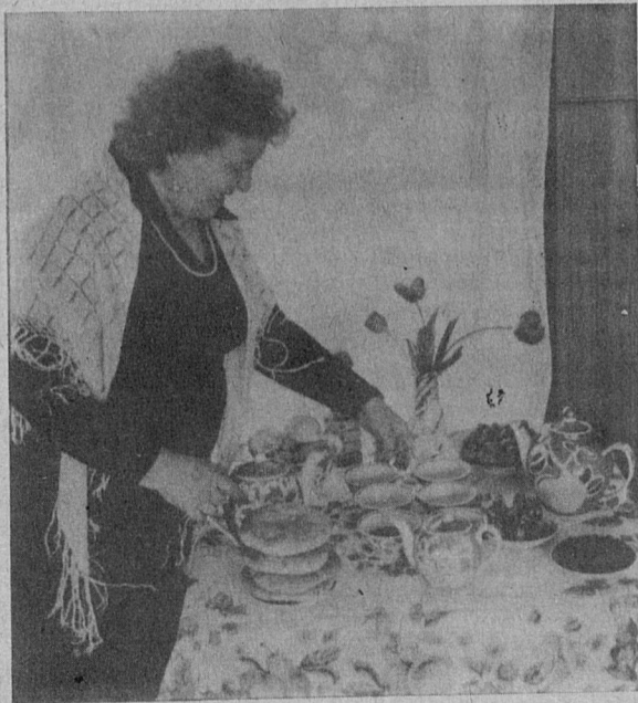
Весело поблескивает на яркой скатерти самовар, а горка румяных блинов и прозрачный янтарный мед в хруст-

Эти книги вы можете приобрести в книжном магазине по адресу: ул. Красных Флотов, 37а, магазин № 180. Т. БЕЛИЧКОВА, внешт. корр.