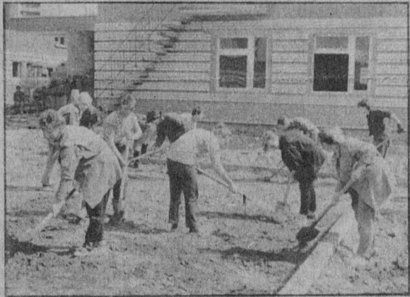
По-ударному работает на благоустройстве территории детского комбината в четвертом микрорайоне студенческий отряд «Время» Ленинградского технологического института имени Ленсовета.