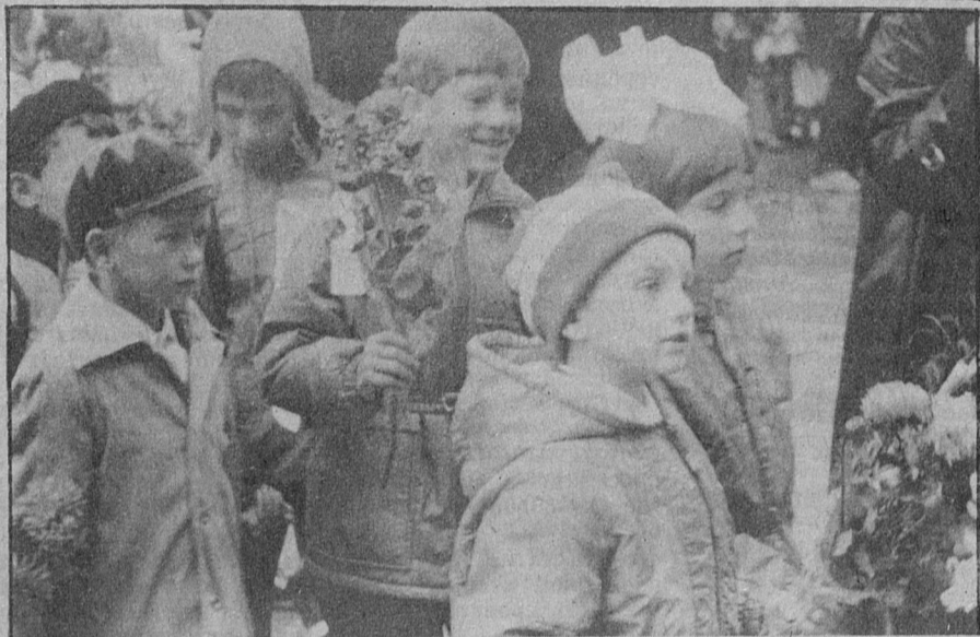
Несмотря на непогоду хорошее настроение у первоклассников школы № 2.

УДИВИТЕЛЬНО точное название нашли для первого в учебном году сбора учеников 1-й школы: «Линейка-старт». В школьном музее собрались те, кто вышел на старт самой длинной в стране знаний дистанции — первоклассники и «нулевички». Вместе с ними в одном ряду — десятиклассники, для них сегодня последний — решающий старт.