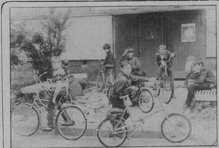
Пока нет дождя.

Требования, предъявляемые современным дорожным движением, бывают часто слишком сложными для восприятия психикой ребенка. Не будем также забывать о следующем. Обзор, а значит, и оценка окружающей обстановки на улице в значительной степени зависят от нашего роста. Маленький рост ребенка вдвойне увеличивает риск его вовлечения в дорожно-транспортное происшествие — во-первых, потому, что из-за этого у него ограничен обзор, а во-вторых, ребенок хуже, чем взрослый, виден водителям.