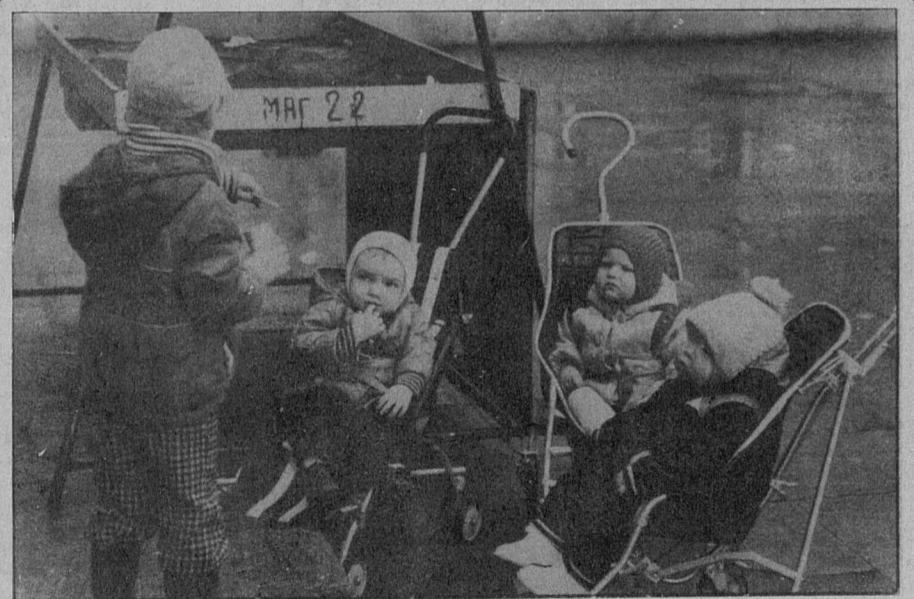
Пока мамы в магазине.