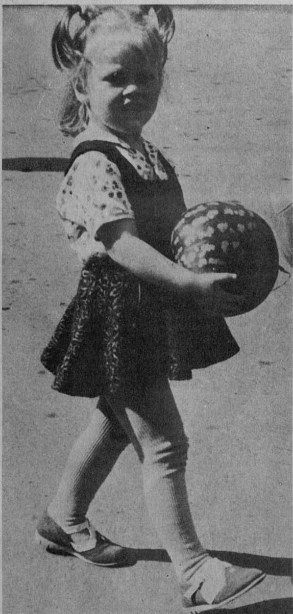
Сейчас как съем...