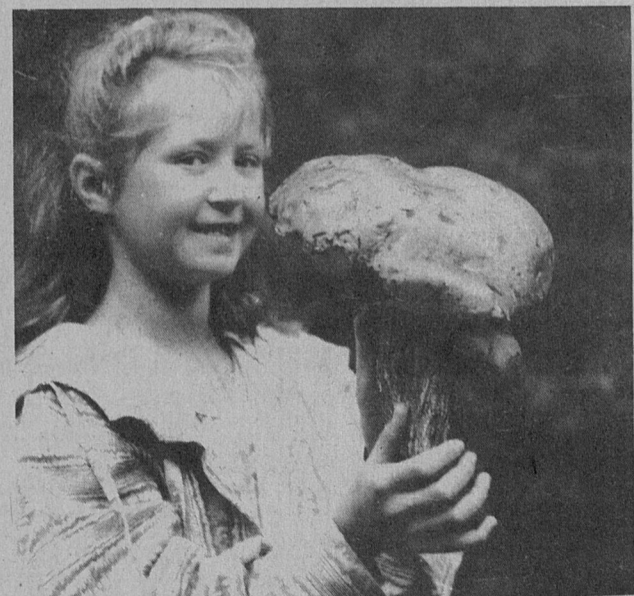
«Вот это гриб!»