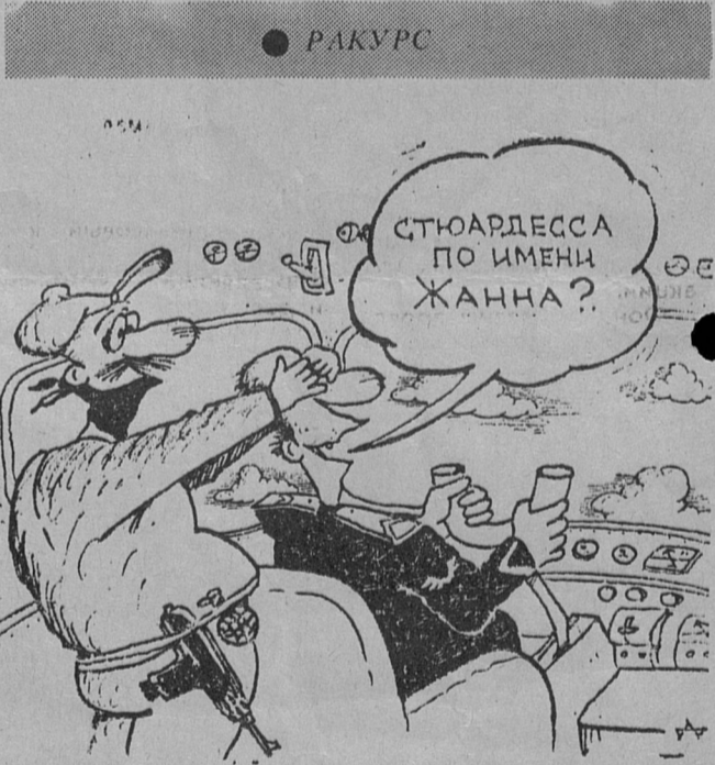
Рис. Александра ДУБОВСКОГО (Днепропетровск).

МЯГКАЯ МЕБЕЛЬ для вашей семьи Звоните в рабочее время по тел. 6-84-56.