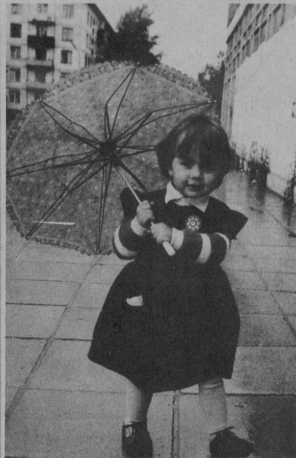
Ну и погода!