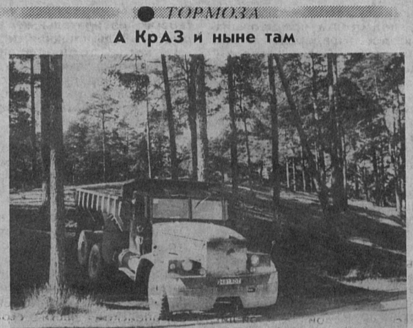
А КраЗ и ныне там