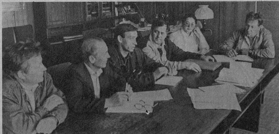
Прошло полмесяца с тех пор, как коллектив арендного предприятия МСУ-32 полностью выкупил его акции, и оно стало акционерным обществом открытого типа «Сосновоборэлектромонтаж».

Конечно, куда вкладывать свой ваучер каждый гражданин решает сам, но вложив его в инвестиционный фонд, вы обезопасите себя от неприятных случайностей (таких, например, как пожар на Камском автомобильном заводе, владельцы акций которого еще долгое время не смогут получать ожидаемых дивидендов). По всем вопросам сдачи приватизационных чеков на ответственное хранение и их последующего обмена на акции специализированного чекового инвестиционного фонда «Созидание» работники отрасли, члены их семей, пенсионеры могут обращаться в кассу ОГК-181 в рабочие дни с 14 до 17 часов 50 минут.