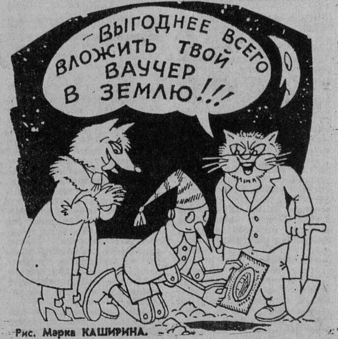
Рис. Марка КАШИРИНА.

1 июня из металлического гаража в районе медсанчасти угнан автомобиль ВА3-2103, государственный номер 68-08, светло-зеленый; перламутровый. Просим всех, кто что-либо знает или услышит о данной пропаже, сообщить по телефону 6-18-78. Вознаграждение гарантируется.