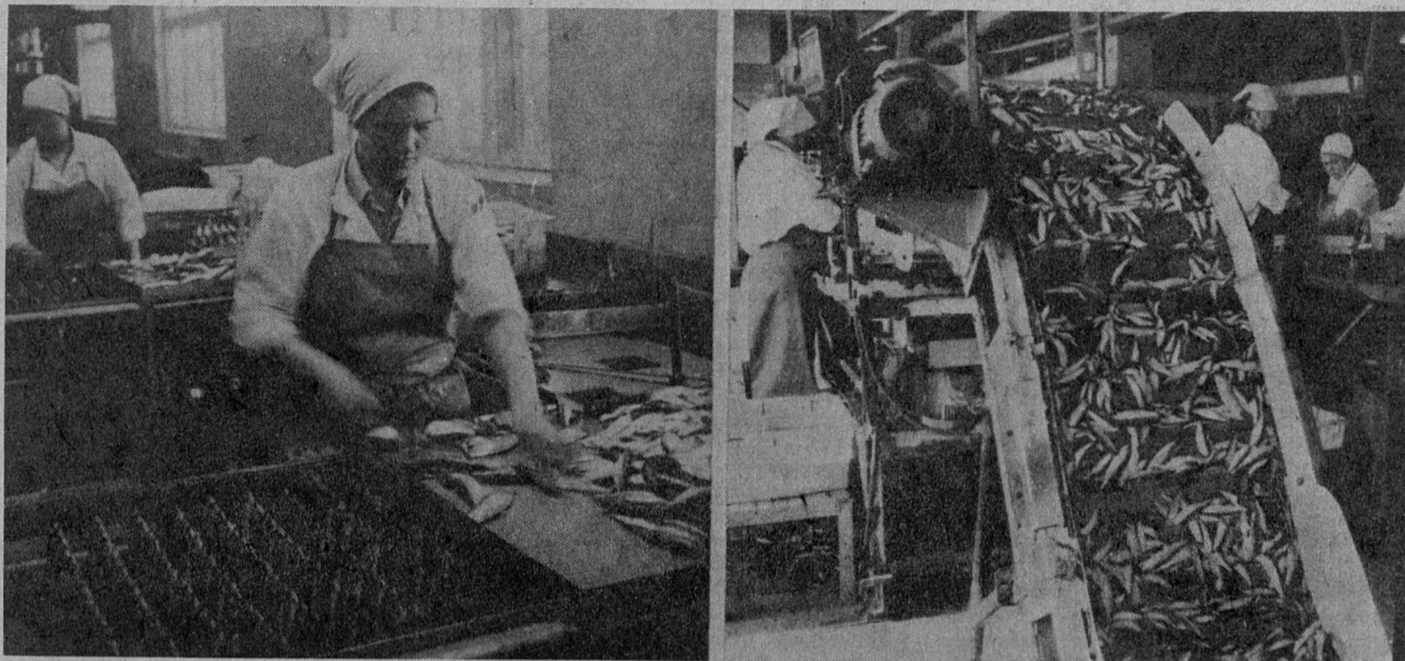
К. ИЮНЬ РЫБАКА

Совсем недавно ТОО «Ручьевский рыбокомбинат» возобновил производство консервов «Шпроты в масле».