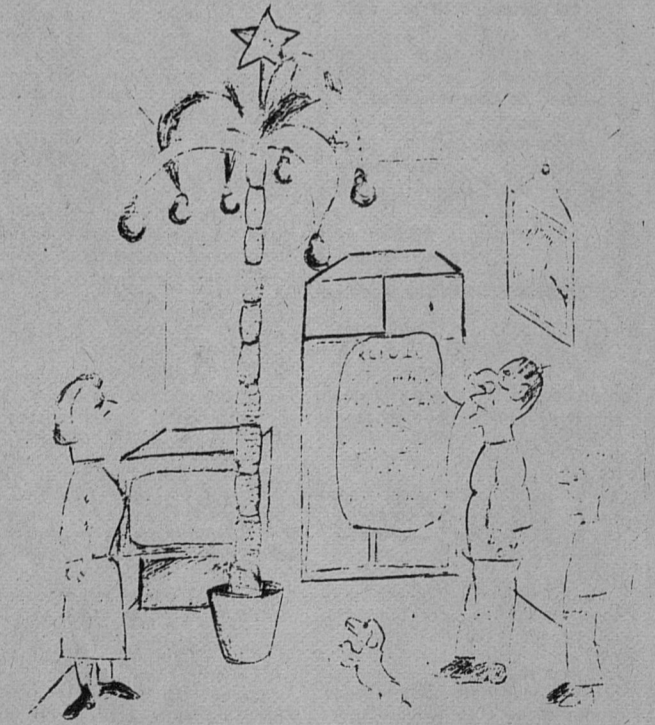
Рис. А. ПОЗДНЯКОВА

Так что следите за душой, уважаемые читатели, и будьте здоровы!